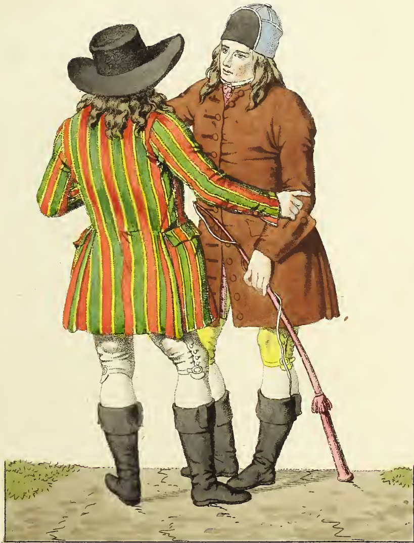
Frønde Siølandfke Bønder nærrejs Kiøbenhavn og Kiøgekanten i deres almindelige Dragt. Zwei seeländische Bauern aus der Gegend von Copenhagen und Kiøge in ihrer gewöhnlichen Tracht.