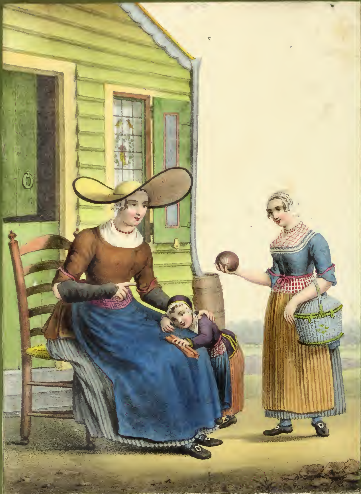
Dessiné d'après nature par H. Greven.