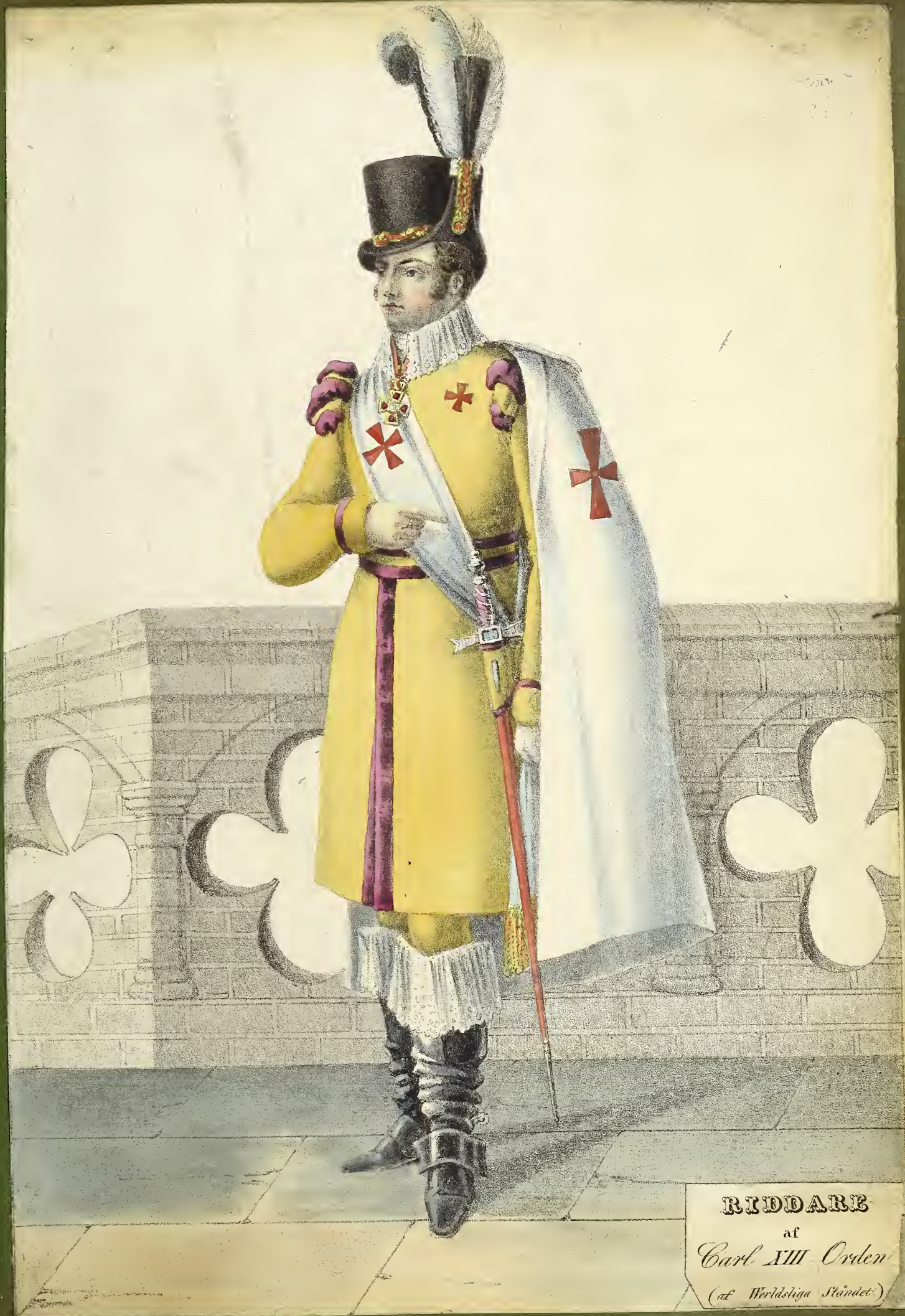
RIDDARE af Carl XIII Orden (af Worldliga Ståndet )