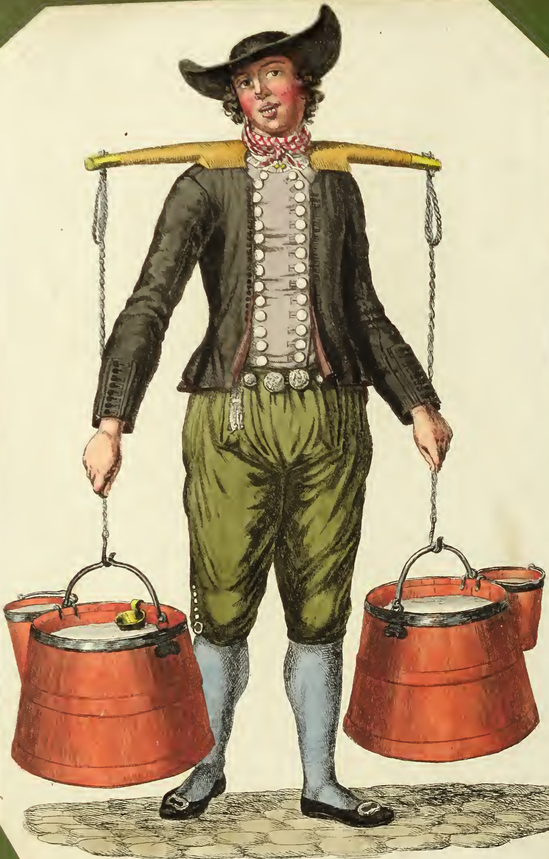
Der Milchmann aus den zu Hamburg gehörenden Ländern