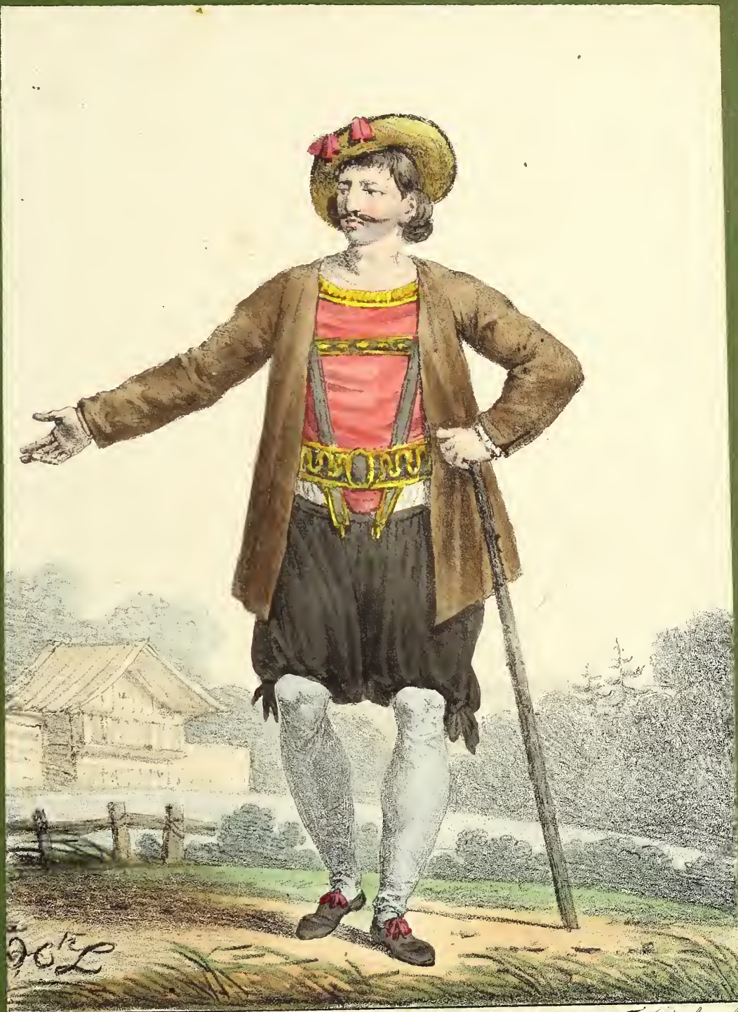
Imp. Lithog. de F. Delpech. Gaysan de la Vallée de Ziller. en Cirol.