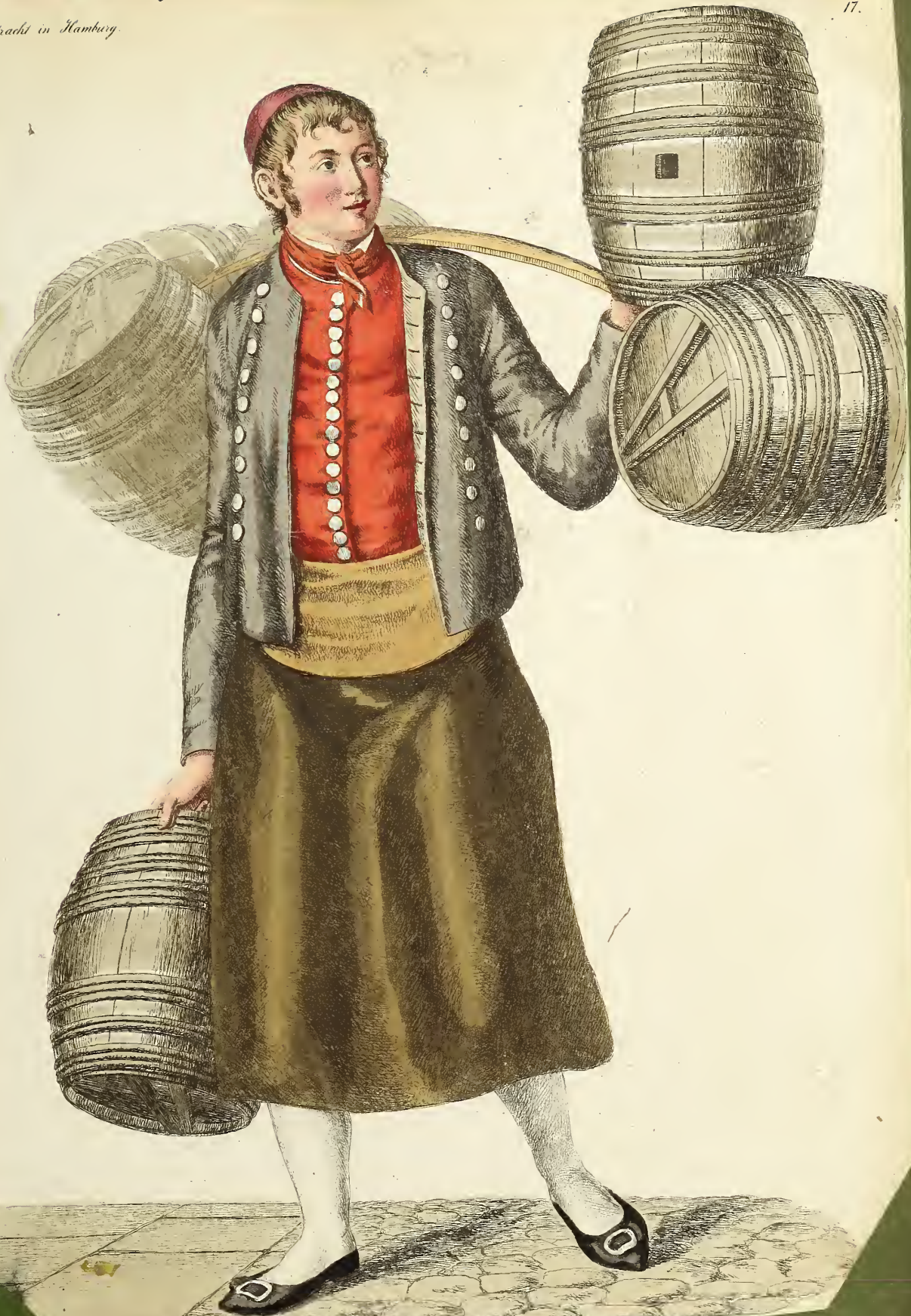
Brauer - bursche.