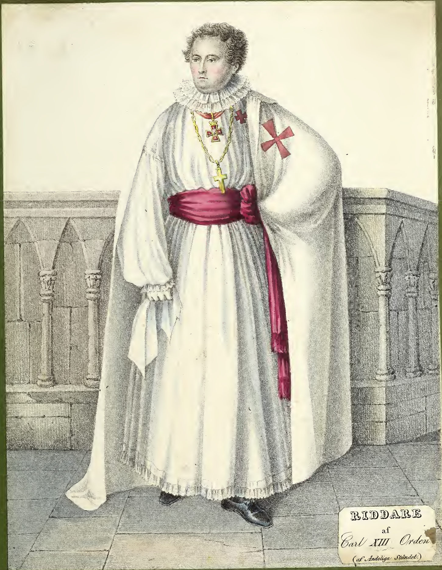
RIDDARE of Carl XIII Orden (of Andeliga Ståndet )